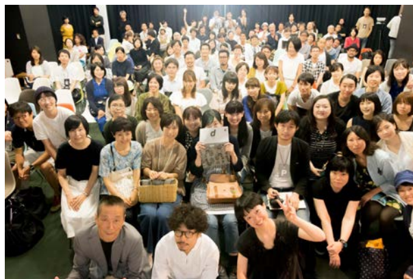
「NIPPONの47人 2017 これからの暮らしかた」展 トーク開催時の様子(8/COURTにて)